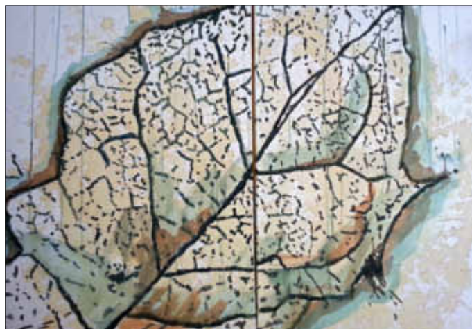
Eines der Schüler-Doppelbilder, die sich allesamt dem Thema „Vergänglichkeit in der Natur“ widmen.