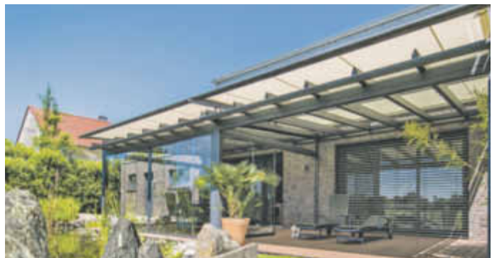
So schön lebt es sich unter einer Markise: Dank Beschattung lässt sich der sonnige Tag im Freien richtig auskosten.